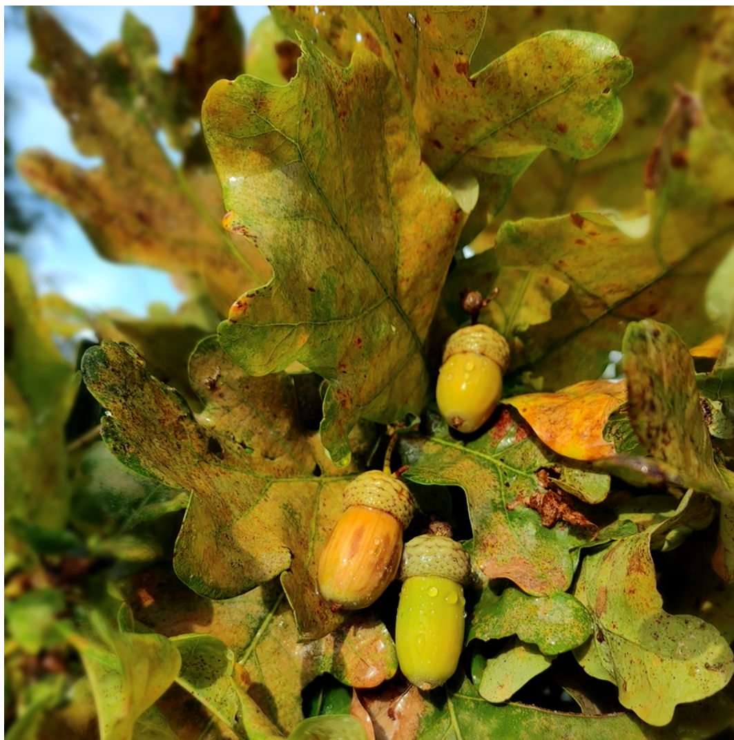
Flora del Veneto, Ghiande (Frutti della Quercia)